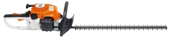
BENZIN-HECKENSCHERE HS 45

Ob Motorsense, Heckenschere oder Motorsäge mit unseren leistungsstarken Benzin-Geräten sind Sie für jede Aufgabe gerüstet. Wir bieten Ihnen eine große Auswahl an STIHL Geräten. Kommen Sie vorbei, wir beraten Sie gerne.