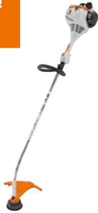
BENZIN-MOTORSENSE FS 38