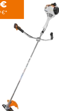
BENZIN-MOTORSENSE FS 55