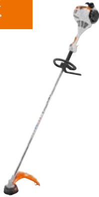
BENZIN-MOTORSENSE FS 55 R